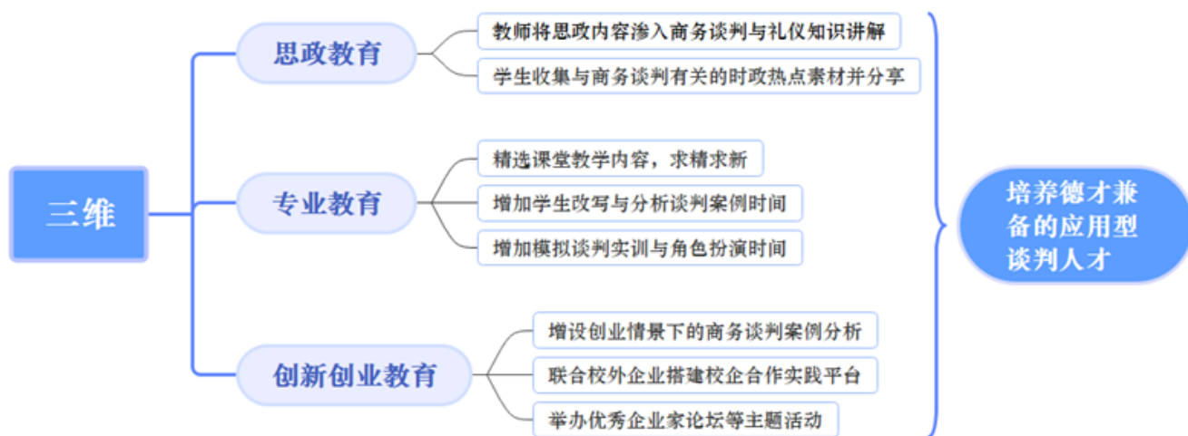
图 1: “三位一体”多维联动的商务谈判与礼仪金课机制

应课程改革潮流、符合时代诉求的创新性教学模式，因而具有极强的现实意义。具体体现在以下几方面：